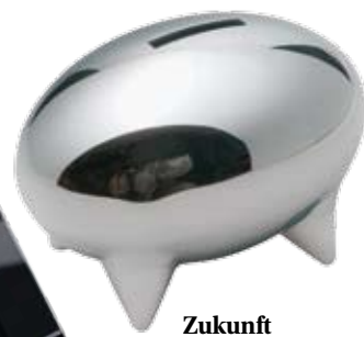
Zukunft „V10K“, von Rado, auch in Rot, Blau und Orange erhältlich, 4300 Euro, im Rado-Store